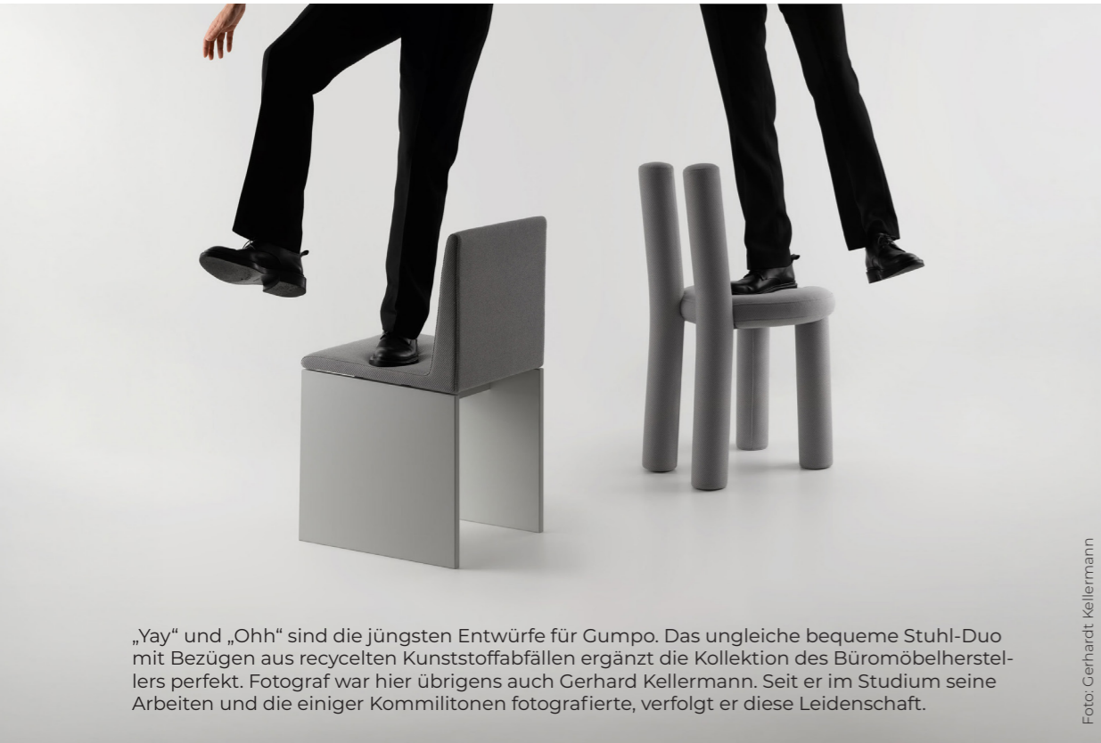
„Yay“ und „Ohh“ sind die jüngsten Entwürfe für Gumpo. Das ungleiche bequeme Stuhl-Duo mit Bezügen aus recycelten Kunststoffabfällen ergänzt die Kollektion des Büromöbelherstellers perfekt. Fotograf war hier übrigens auch Gerhard Kellermann. Seit er im Studium seine Arbeiten und die einiger Kommilitonen fotografierte, verfolgt er diese Leidenschaft.